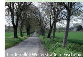
Lindenallee Weilerstraße in Fischenich