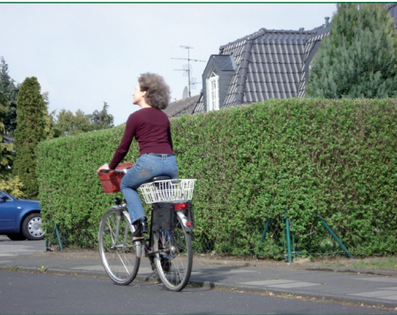
Stressfrei auf dem Fahrrad

Auf Antrag der GRÜNEN wurde für die Stadt Hürth ein Radwegekonzept erstellt. Bestehende Wege wurden auf Mängel und Unfallschwerpunkte überprüft, die kurzfristig beseitigt werden. Besonders die Sicherheit an Kreuzungen für stressfreies und zügiges Radfahren ist uns wichtig. Wenn man bedenkt, dass 50% aller Autofahrten im Nahbereich durch das Fahrrad eingespart werden können, lohnt sich auch die Investition in neue, ortsteilverbindende Routen, denn es wird mit vergleichbar geringen Geldmitteln eine sehr hohe Mobilität erreicht. Auch mit günstigeren Ampelschaltungen und bequemen Abstellmöglichkeiten am Zielort wollen wir in Hürth das Radfahren als gesunde, umweltfreundliche und lebensbejahende Alternative zum Auto erleichtern.