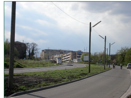
Der Hürther Bogen

Endlich - der Bau der Straßenbahngleise ins Hürther Zentrum ist offiziell beantragt und soll bis 2013 begonnen werden. Schon vor Jahren hat der Rat mit Unterstützung der GRÜNEN dies beschlossen. Die Linie wird aber nur dann gebaut, wenn die Stadt Hürth auch den Betrieb der Straßenbahnlinie bestellt. Hierfür setzen wir uns ein. Denn um zum Einkaufszentrum in Hürth-Mitte zügig und umweltfreundlich zu kommen, ist die Anbindung durch die Bahn unabdingbar. Ebenso wichtig ist es uns, das Angebot der bestehenden Linie 18 zwischen Köln und Hermülheim zu verbessern. Bisher fahren die Züge am Abend und an Wochenenden nur im 30-Minuten-Takt. Deshalb wollen wir den Takt auf attraktive 15 Minuten verbessern.